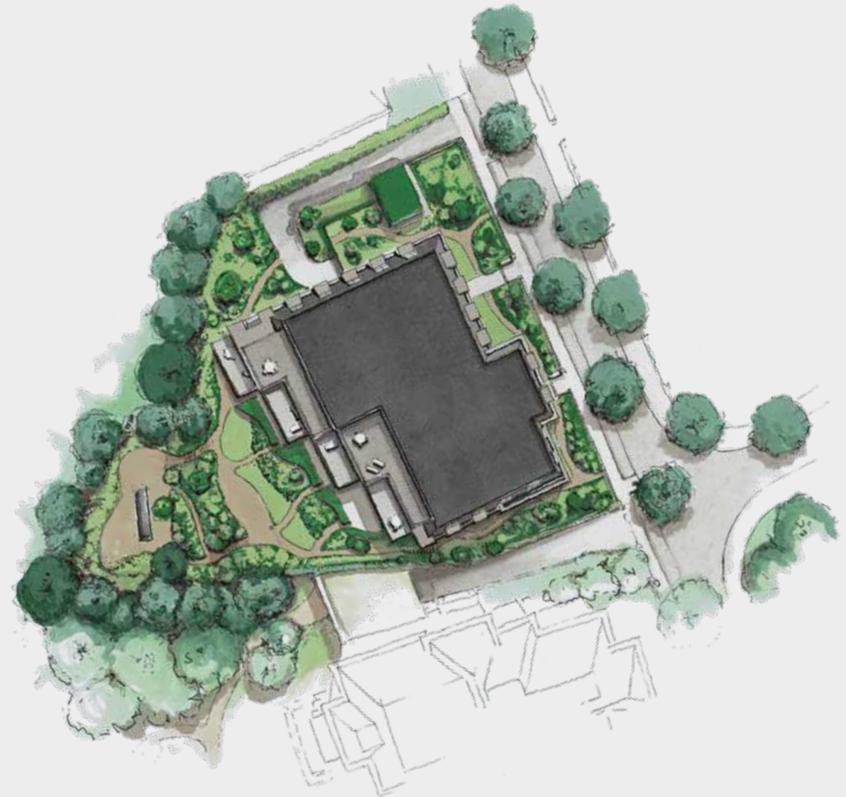
Bovenaanzicht Elion Park met royale balkons en terrassen met uitzicht op de eigen tuin en het aangrenzende park.

Het ontwerp van de gezamenlijke besloten villatuin sluit heel natuurlijk aan bij het omliggende cultuurhistorische parklandschap. Wonen in Elion Park is leven in een oase van schoonheid en rust, tussen stad en zee.